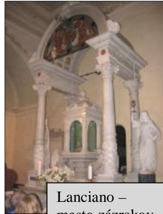
Lanciano – mesto zázrakov