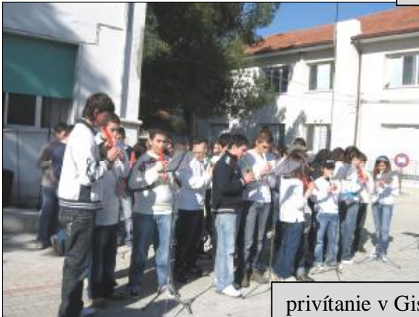
privítanie v Gissi